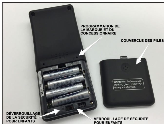
Figure 1. Installation des piles et de la sécurité pour enfant