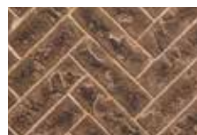
Tavern Brown Herringbone (à un côté seulement)