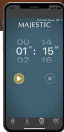
Minuterie de combustion préréglée