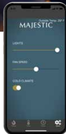
Éclairage, vitesse du ventilateur et plus...