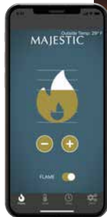
Marche/arrêt et hauteur de la flamme