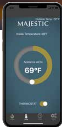
Contrôle de la température